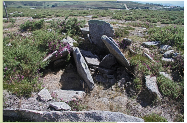
Pedra da Xesta