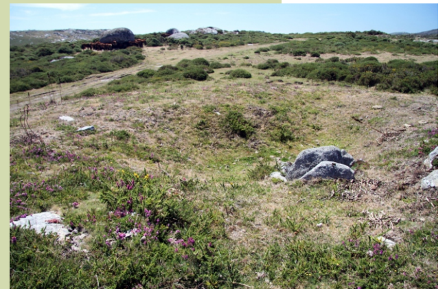
Arca do Outeiro