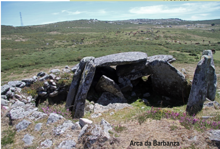
Arca da Barbanza