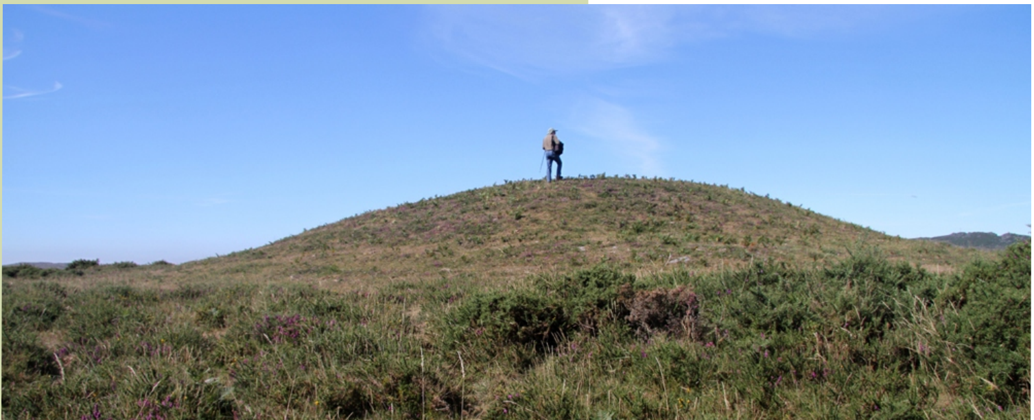
Mámoa do Outeiriño do Pan