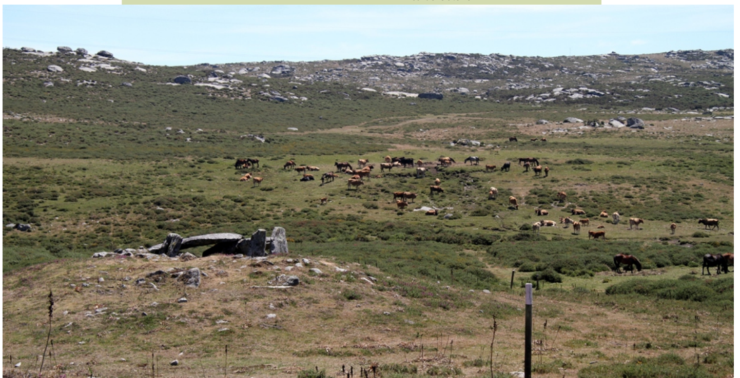
Arca da Barbanza